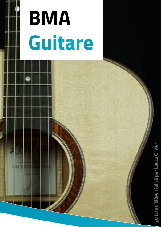
guitare d'élève réalisé par Lucas Olivier