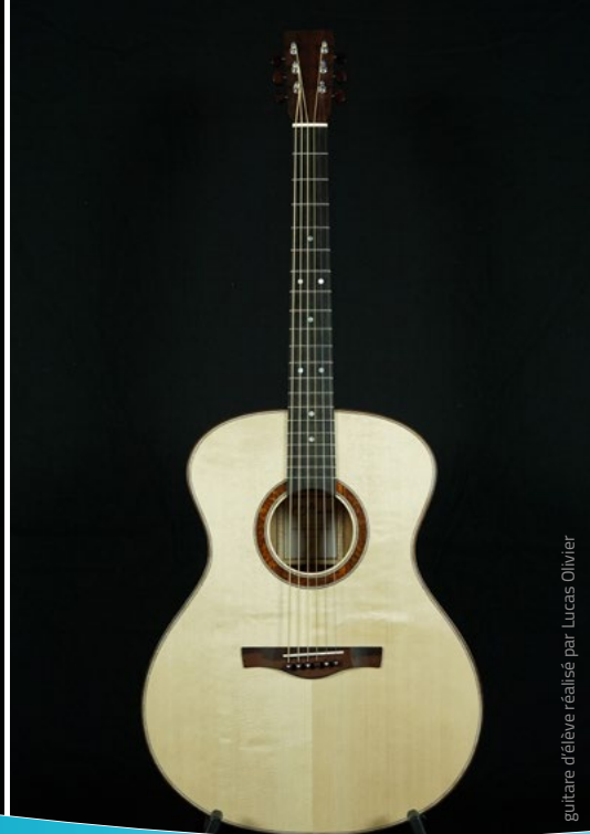
guitare d'élève réalisé par Lucas Olivier