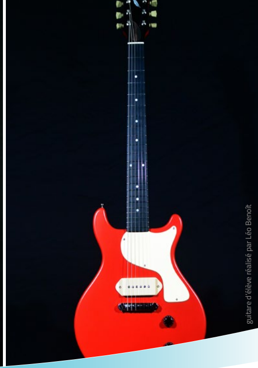
guitare d'élève réalisé par Léo Benoit

Le.la titulaire de Brevet des Métiers d'Art Technicien.ne en Facture Instrumentale option guitare intervient à tous les niveaux de fabrication, de réparation et de commercialisation.